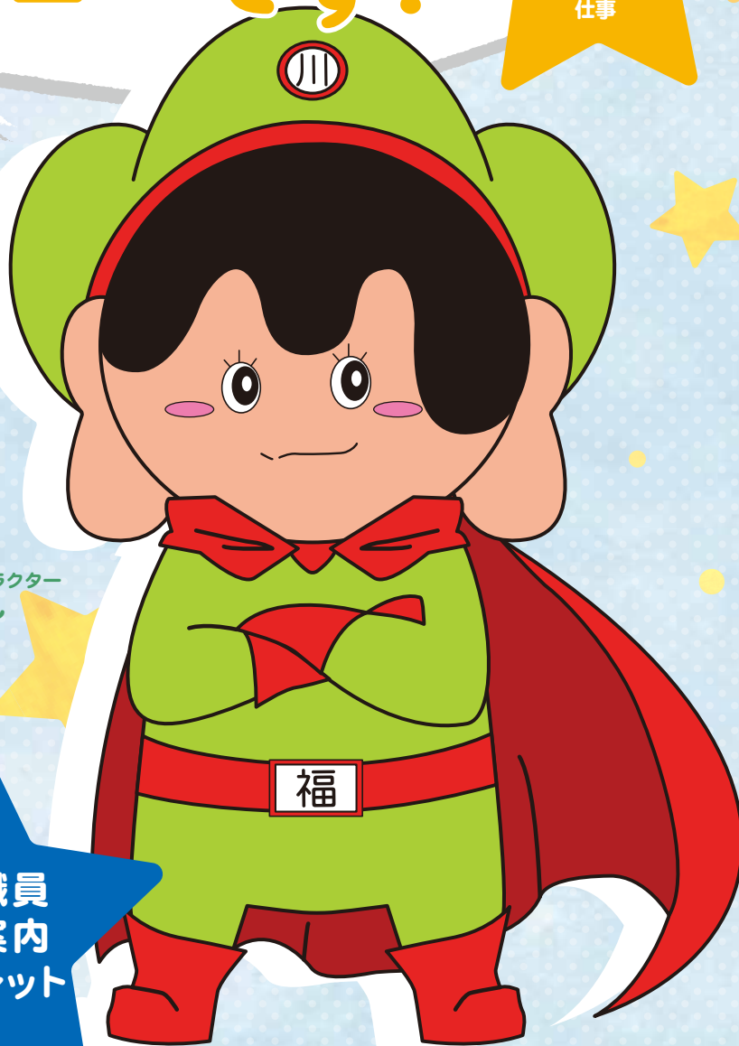
川福会イメージキャラクター かわふくん