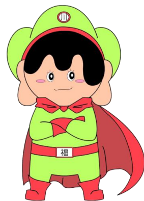
川福会イメージキャラクター 『かわふくん』